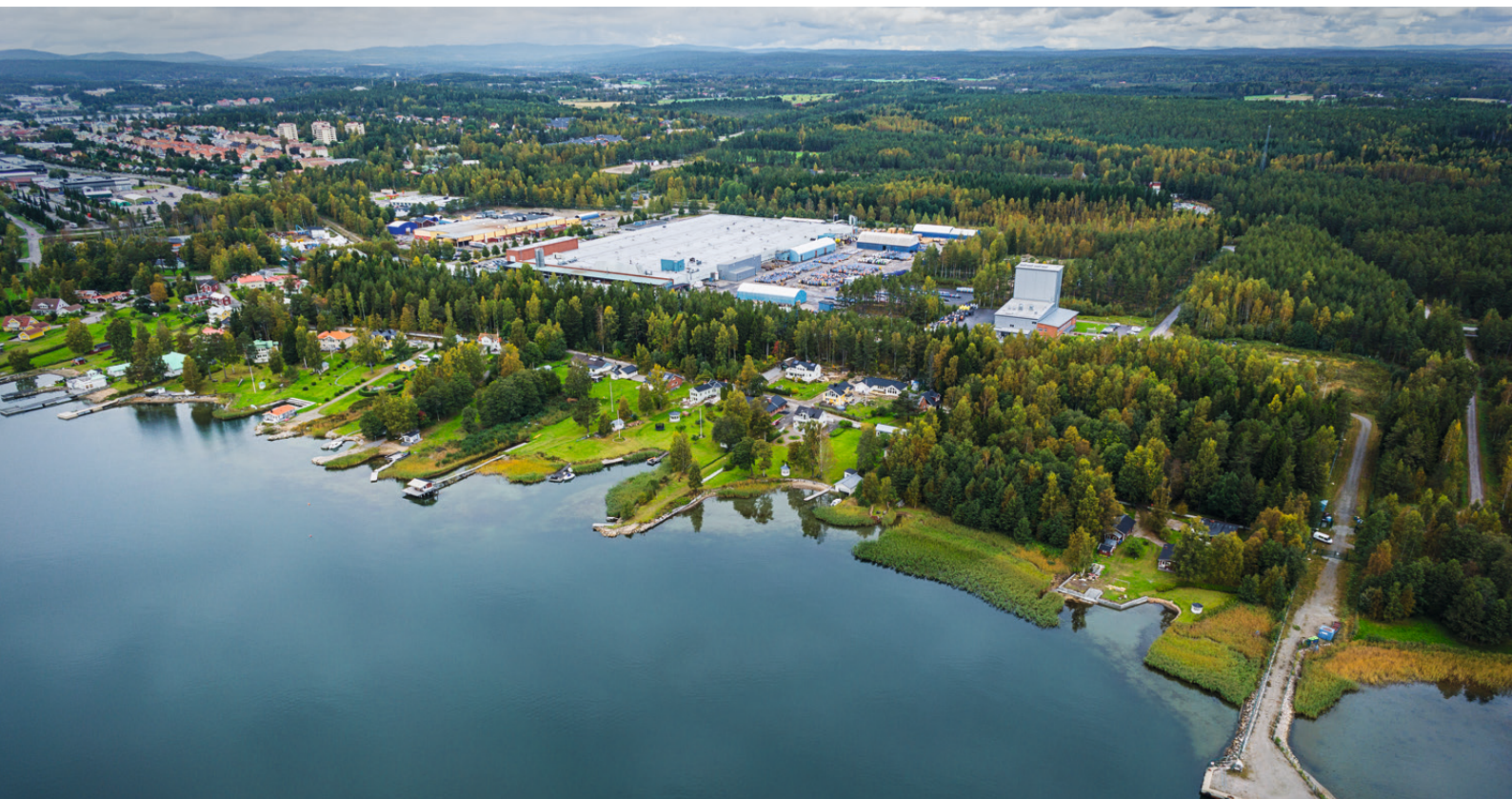
Hexatronic Cables & Interconnect AB i Hudiksvall